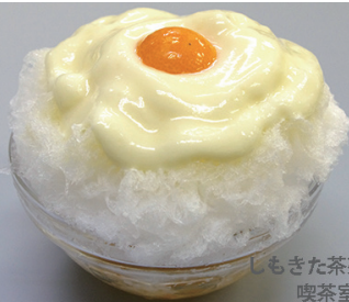
しもきた茶苑大山 喫茶室